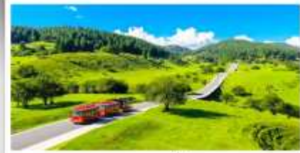
เวนางฟ้า

เดินทางโดย: สายการบินดงซิงเจียงเป่ย์ (PN)