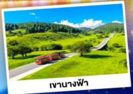
เจานางฟ้า