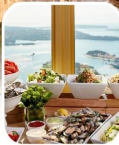
SKYFEAST BUFFET SYDNEY TOWER