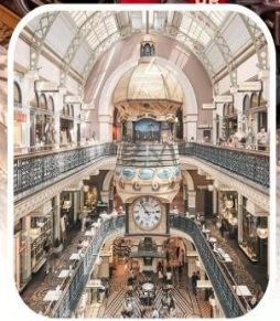
QUEEN VICTORIA BUILDING