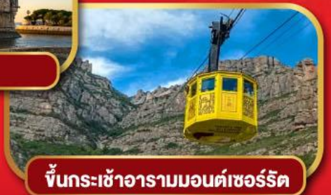
ขึ้นกระเช้าอารามมอนต์เซอร์ริต