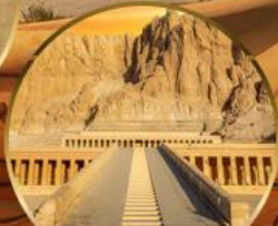
หุบเขากษัตริย์