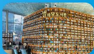
ห้องสมุดสตาร์ฟิล