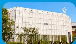
บริกคินกาซึ