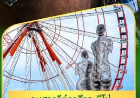
อนุสาวรีย์อาลีและนีโน่