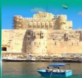
บึงนราการ Qulte Bay