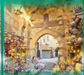
ตลาดผ่านเวลาอัลลี