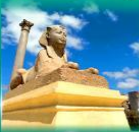
เสานินมืองเบย์