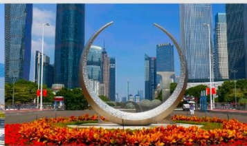
จัตุรัสฮั่วเจิง

*ทางบริษัทฯ ขอสงวนสิทธิ์ในการสลับโปรแกรมทัวร์ตามความเหมาะสมขึ้นอยู่กับสถานการณ์ทำงาน โดยคำนึงถึงผลประโยชน์ของลูกค้าเป็นสำคัญ