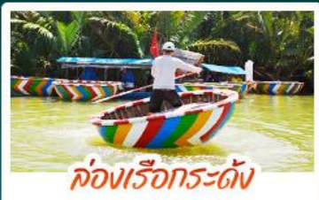
ล่องเรือกระทง