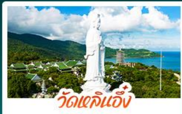
วัดเข็กนั้ง