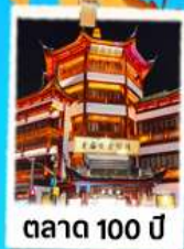
ตลาด 100 ปี