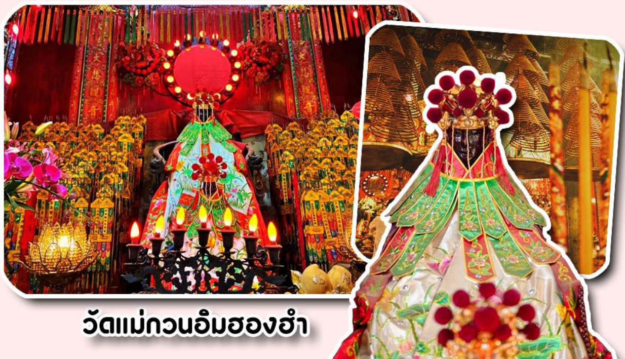
วัดแม่กวนอิมฮองฮำ

พาท่านเดินทางไปไหว้ขอพรขอเงิน วัดแม่กวนอิมฮองฮำ วัดเก่าแก่ของฮ่องกงสร้างตั้งแต่ปี ค.ศ. 1873 เป็นวัดขนาดเล็กที่มีชาวฮ่องกงศรัทธาหนักถือกันเป็นอย่างมาก วัดแห่งนี้เป็นที่ประดิษฐาน องค์เจ้าแม่กวนอิมฮองฮำ ที่มีชื่อเสียงเรื่องการให้กู้ยืมเงิน เชื่อกันว่าท่านช่วยพลิกฟื้นเศรษฐกิจของชาวฮ่องกง ผู้คนจึงนิยมมายืมเงินทำธุรกิจจนสำเร็จร่ำรวย รุ่งเรือง โดยให้ท่านอธิษฐานขอพรต่อหน้าเจ้าแม่กวนอิมฮองฮำ พร้อมกับระบุวันเวลาในการขอพรด้วย จากนั้นนำธนบัตรตามฐานะและศรัทธาที่เราจะนำเป็นสื่อในการขอพร เขียนจำนวนเงินที่ต้องการลงไปด้วย ใส่สกุลเงินยี่งดีใหญ่ แล้วนำเงินใส่ในซองแดง ควรเตรียมซองแดงไปเอง นำซองแดงไปวนรอบกระถางรูป วนขวาจำนวน 3 ครั้ง แล้วเก็บซองแดงในกระเป๋าสตางค์ เป็นเงินขวัญถุง ถ้าประสบความสำเร็จตามที่มุ่งหวังให้นำเงินในซองแดงทำบุญหยอดตู้ที่วัดแห่งนี้ในโอกาสต่อไป วิธีไหว้ให้ปัง ให้ได้โชคลาภเงินทอง ต้องไปกับเราเท่านั้น