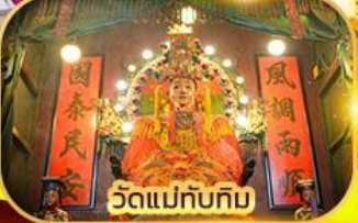
วัดแม่ทับทิม