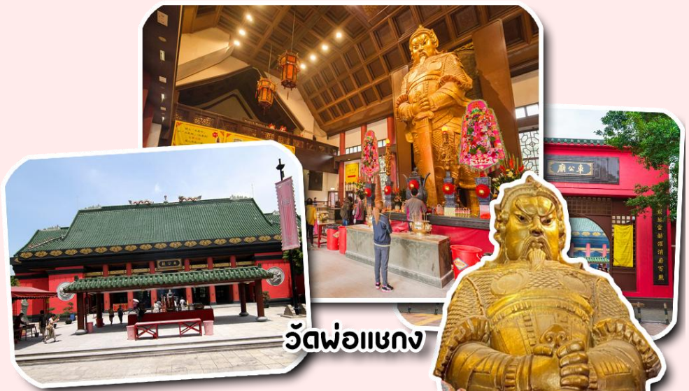
วัดพ่อแชกง