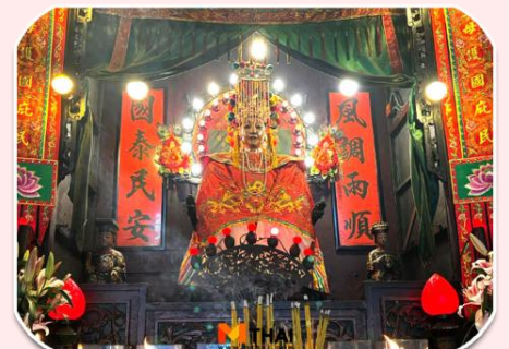
นางฟ้าพามู

จากนั้นเดินทางไปต่อที่ วัดทินหัว (วัดเจ้าแม่ทับทิม) เป็นวัดเก่าแกในฮ่องกง สมัยก่อนฮ่องกงเป็นหมู่บ้านชาวประมง ซึ่งคนจะให้ความเคารพนับถือเจ้าแม่ทับทิมทินหัวเป็นอย่างมาก เพราะเชื่อว่าเป็น เทพีแห่งท้อง