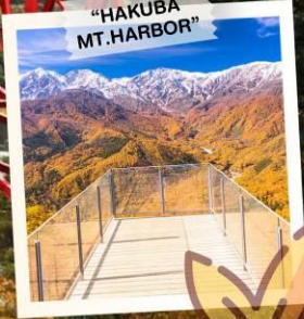
"HAKUBA MT. HARBOR"