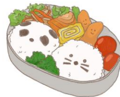
● อาหารสำหรับเด็ก ( 2-11 ปี ) * วัตถุประสงค์ขึ้นอยู่กับทาว์ราน