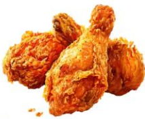
● เนื้อสัตว์ปีก (ไก่)