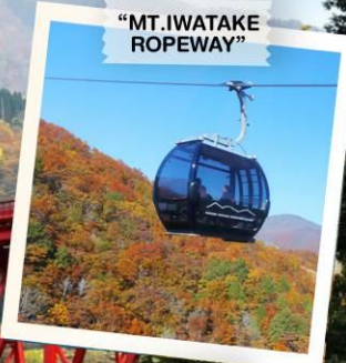
"MT. IWATAKE ROPEWAY"