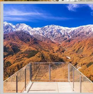
“HAKUBA MT. HARBOR”