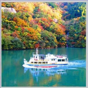
"SHOGAWA YURAN CRUISE"