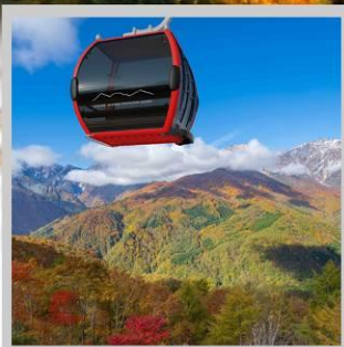
“MT. IWATAKE ROPEWAY”