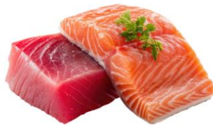
● เนื้อปลาดิบ