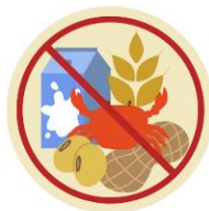
● แพ้อาหาร / อื่นๆโปรดระบุ