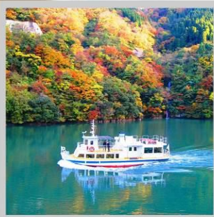
“SHOGAWA YURAN CRUISE”