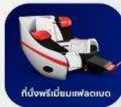
ที่นั่งพรีเมียมแพลนเน็ต