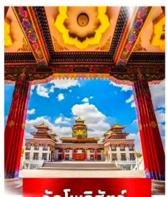
วัดโพธิ์สัตว์