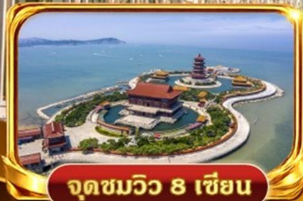
จุดชมวิว 8 เชียง