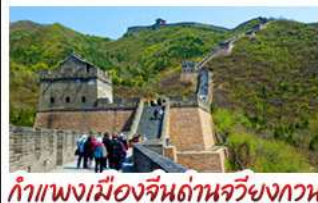
กำแพงเมืองจีนด้านจิวยงกวน

UNIVERSAL STUDIO BEIJING DISNEYLAND SHANGHAI รถไฟความเร็วสูง - ถ่ายรูปห่อไข่มุก กำแพงเมืองจีนด้านจิวยงกวน มือพิเศษ เปิดปักกิ่ง, สุกี่หม้อไฟ BUFFET