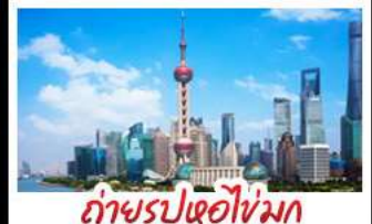
ถ่ายรูปไข่มุก