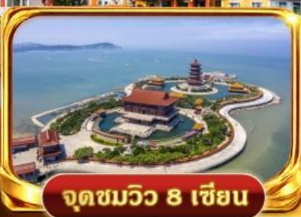
จุดชมวิว 8 เซียน