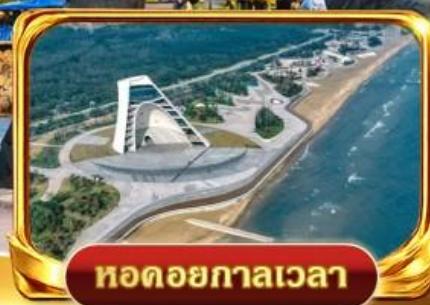
หอดอยกาลเวลา