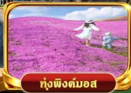
กุงฟิงคิมอส