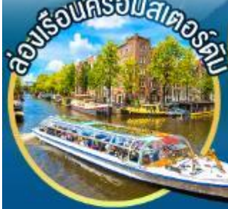
ล่องเรือนครอัมสเตอร์ดัม