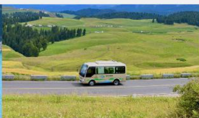
ทุ่งหญ้าเจียนปูลาเค่อ