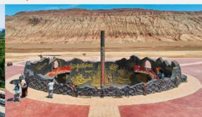
ภูเขาเปลวเพลิง

*ทางบริษัทฯ ขอสงวนสิทธิ์ในการสลับโปรแกรมทัวร์ตามความเหมาะสมขึ้นอยู่กับสถานการณ์หน้างาน โดยคำนึงถึงผลประโยชน์ของลูกค้าเป็นสำคัญ