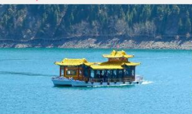
ล่องเรือทะเลสาบเกียนฉือ