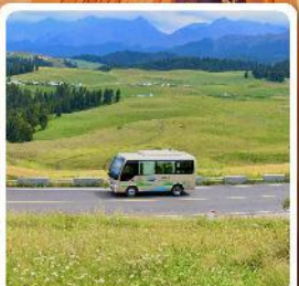
ทุ่งหญ้าเจียนปูลาเค่อ