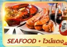
SEAFOOD + ไวน์แดง