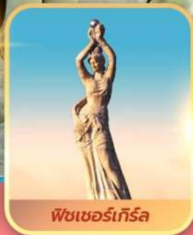
พีชเซอร์เกิร์ล