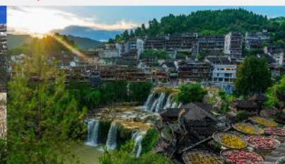
หมู่บ้านโบราณฝูหรงเจิน

*ทางบริษัทฯ ขอสงวนสิทธิ์ในการสลับโปรแกรมทัวร์ตามความเหมาะสมขึ้นอยู่กับสถานการณ์หน้างาน โดยคำนึงถึงผลประโยชน์ของลูกค้าเป็นสำคัญ