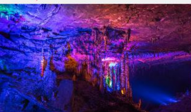
ต้าเก้าเทพ