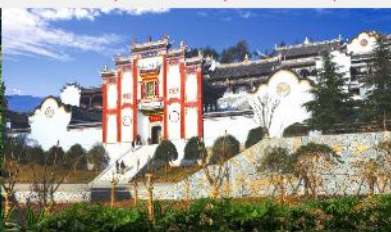
บ้านเกิดชวีหยวน