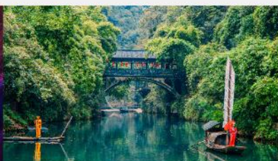
หมู่บ้านซานเสีเหรินเจีย