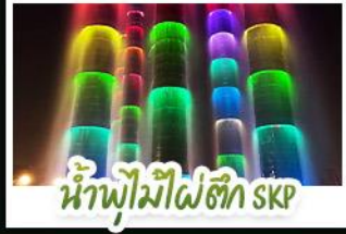
น้ำพุไม้ไผ่ตึก SKP

ภูเขาสี่ดรุณี • อุทยานหวงหลง • เมืองโบราณซงพาน • ทะเลสาบเต๋อซี อุทยานจิวจ้ายโกว • จิตรกรรมฝาผนัง • รูปปั้นหมีแพนด้าเซลฟี่ ถนนโบราณชอยกว้างชอยแคบ • ถนนคนเดินไท่กุ่หลี่ • ถนนคนเดินซุมซี แพนด้ายักษ์ปิ่นตึก ณ ตึก IFS • วัดต้าจื่อ • น้ำพุไม้ไผ่ตึก SKP