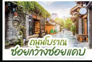
ถนนโบราณ ชอยกว้างชอยแคบ