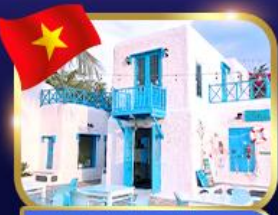
คาเฟ่สไตล์ซานโตรินี่ ชันตรา มารีน่า