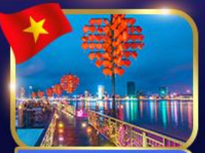
สะพานแห่งความรัก ดานัง