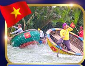
ล่องเรือกระดัง หมู่บ้านกัมบาน