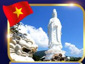
ขอพรองค์กวนอิม วัดหลินอึ้ง