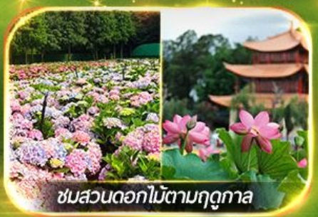
ชมสวนดอกไม้ตามฤดูกาล

นั่งกระเช้ากุเขาศิมะเจี้ยวจื่อ ชมน้ำตกสุดอลังการสวนน้ำตกคุนหมิง ช้อปปิ้งถนนคนเดินหนานผิงเจี๋ย, ชมดอกไม้ตามฤดูกาล