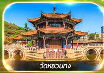
วัดหยวนทาง