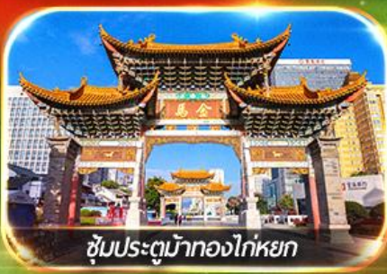
ชมประตูม้าทองไถ่หยก