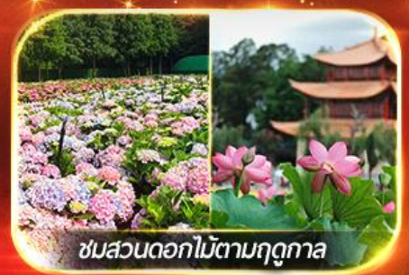
ชมสวนดอกไม้ตามฤดูทงกา

นั่งกระเช้าสู่ภูเขาหิมะมังกรหยก ชมโชว์ทิเบต "Impression Lijiang" สุดอลัง เชคอินคาเฟ่วิวภูเขาหิมะ, ชมดอกไม้ตามฤดูทงกา