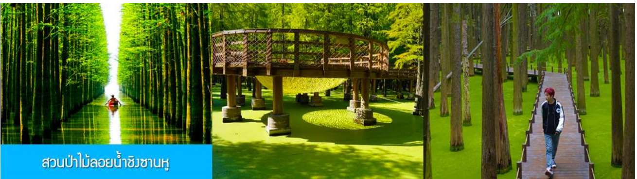
สวนป่าไม้ลอยน้ำชิงชานหู

หลังอาหารเช้าท่านเดินทางโดยรถบัสสู่เมืองหลิงอัน 临安市 (ระยะทาง 175 กม. ใช้เวลาเดินทางราว 2 ชั่วโมงเศษ)