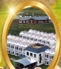
ที่พักสไตล์กระท่อม