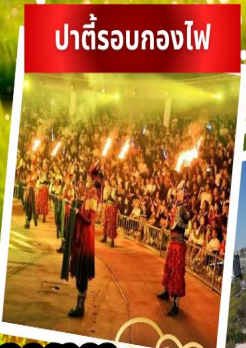
ปาร์ตี้รอบกองไฟ