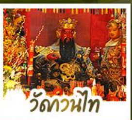
ว้ดกวนน้ีไท