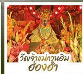
ว้ดเจ้่าแ่ม่กวนอ้ิมอ้องฮ้่า