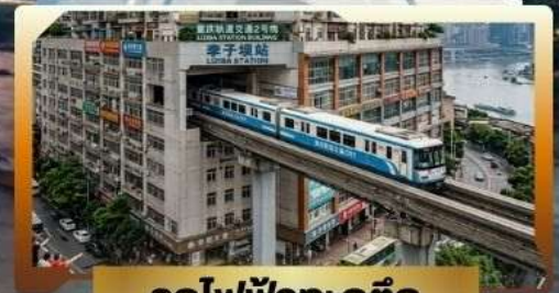
รถไฟฟ้าทะลุถึก