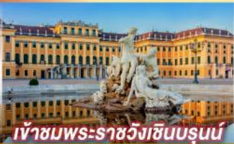
เข้าชมพระราชวังฮินบรุนน์