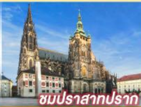
ชมปราสาทปราก