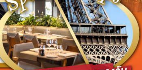
รับประทานอาหารกลางวันบนหอคอไอเฟล