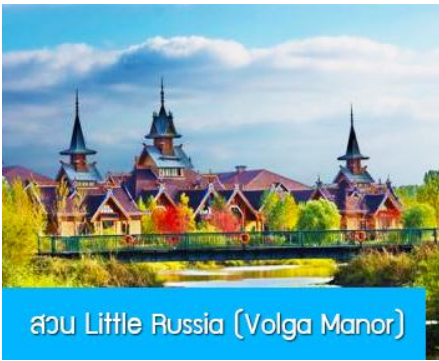
สวน Little Russia (Volga Manor)

หลังอาหารนำท่านเดินทางสู่ เมืองฮาร์บิน 哈尔滨市 (ระยะทาง 250 กม. ใช้เวลาเดินทางราว 3 ชั่วโมงเศษ) เมืองฮาร์บินเป็นเมืองที่ตั้งอยู่ทางตอนเหนือของจีนที่มีพรมแดนติดกับประเทศรัสเซีย เป็นเมืองเอกของมณฑลเฮยหลงเจียง มีสมญานามว่าเป็นกรุงมอสโกตะวันออก และได้ชื่อว่าเป็นเมืองหลวงแห่งฤดูหนาวเนื่องจากเมืองแห่งนี้มีช่วงฤดูหนาวยาวกว่าฤดูร้อน มีเทศกาลแกะสลักน้ำแข็งนานาชาติจัดขึ้นที่เมืองนี้ในช่วงฤดูหนาวของทุกปี เป็นจุดหมายปลายทางสำหรับนักท่องเที่ยวทั้งในและต่างประเทศที่ชื่นชอบความสวยงามของหิมะในฤดูหนาว