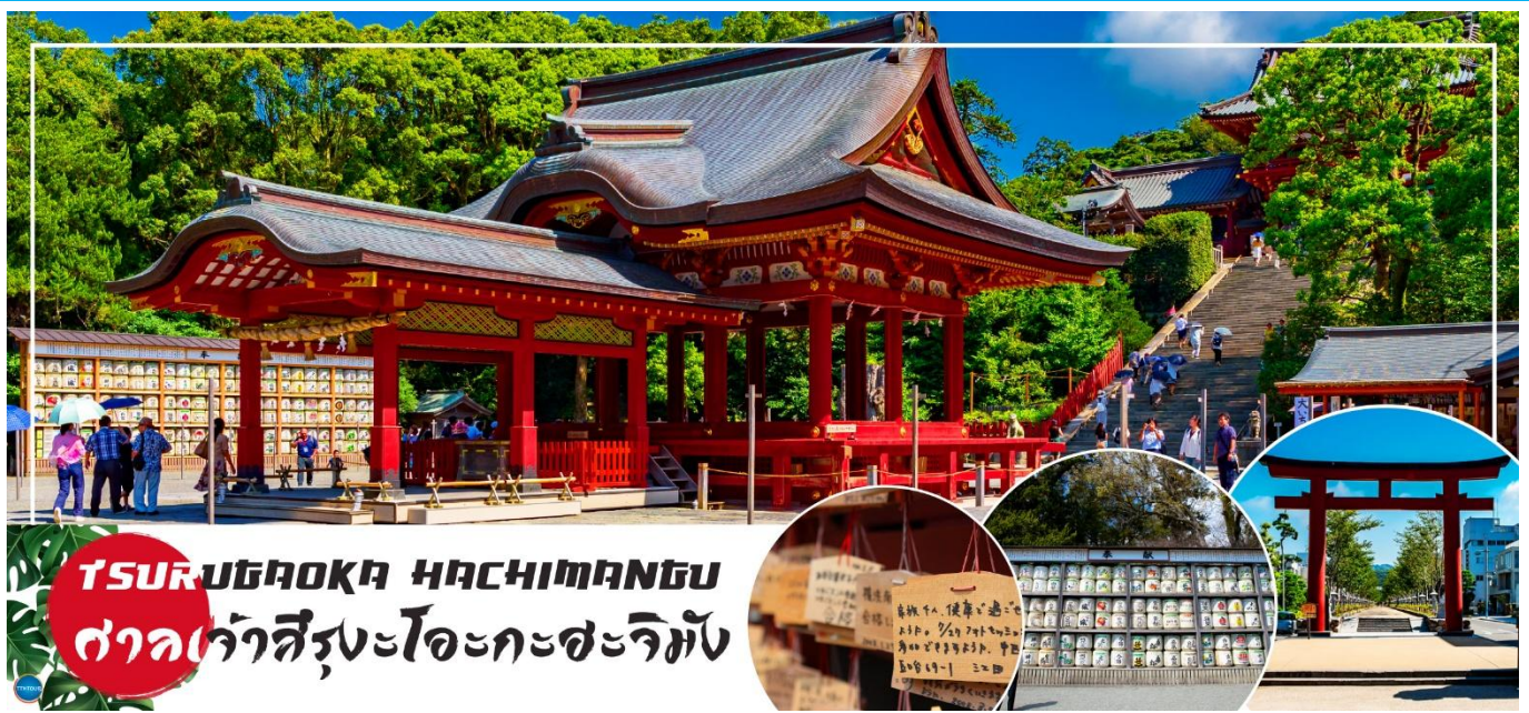
TSURUGAOKA HACHIMANGU ศาลเจ้าสึรุงะโอะกะสะจิมัง

วันที่สอง ท่าอากาศยานนานาชาติ นาริตะ – เมืองคามาคุระ – ศาลเจ้าสึรุงะโอะกะ สะจิมัง – ถนนโคมาจิโดริ – เกะเอโนชิมะ – ศาลเจ้าเอโนชิมะ – ถนนเบ็นไซเท็นนากามิสะ – เมืองยามานาชิ – ออนเซ็น