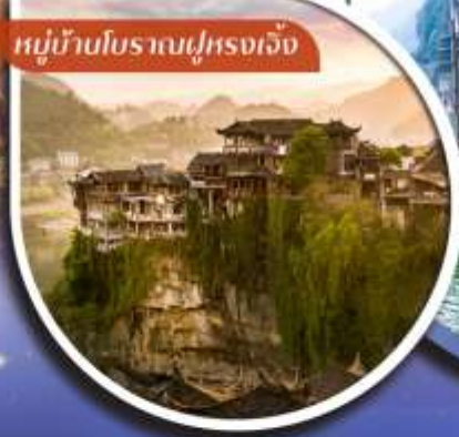
หมู่บ้านโบราณฟูหลงเจิ้ง

คอนเฟิร์มออกเดินทาง ตั้งแต่วันที่ 10 กุมภาพันธ์