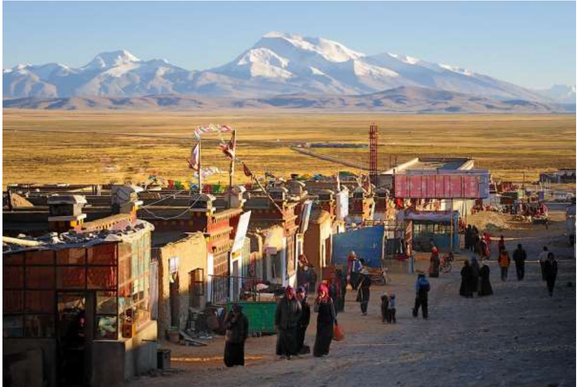
ที่พัก Dharchen Himalaya hotel