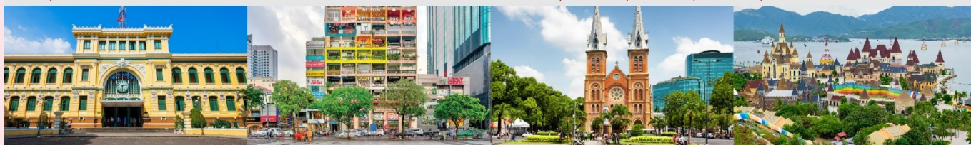
ไพรบ์นีย์กลางโฮจิมินห์