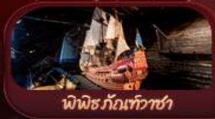
พิพิธภัณฑ์เก่า