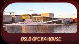
OSLO OPERA HOUSE

รหัสโปรแกรม : SEK156 9วัน 6คืน ทำสติกเกอร์-ออกใบเงิน