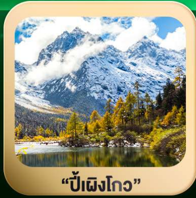
“ปี่ผิงโกว”

ชมธรรมชาติ 2 อุทยานขึ้นชื่อ อุทยานภูเขาสีดรุณี + อุทยานปี่ผิงโกว สะพานหนานเฉียว • ถนนคนเดินไท่กุ่หลี่ + ซุนซีลู่ + Pop Mart • ตงเจียวจื่อ