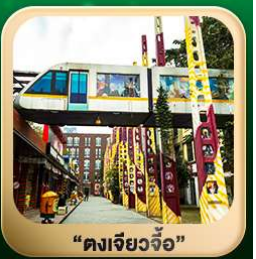
“ตงเจียวจื่อ”