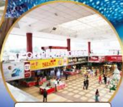
ตลาดกึ่งเปีย