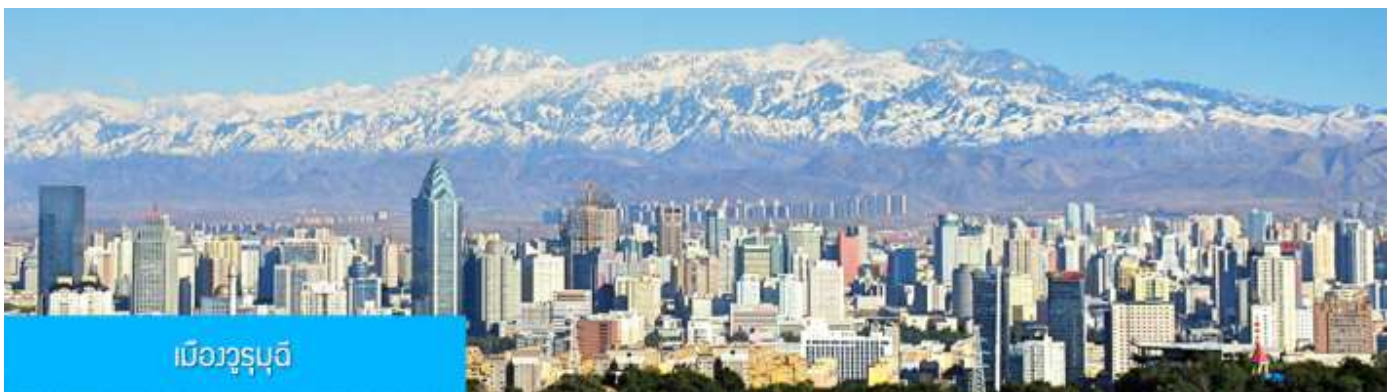
เมืองูรูมูฉี