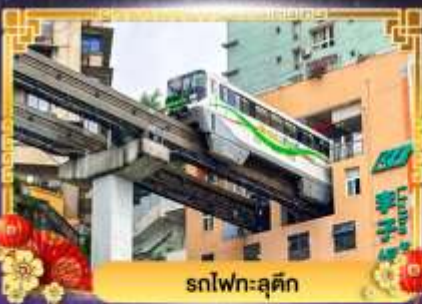
รถไฟฟ้าฉงชิ่ง