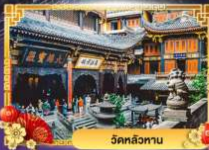
วัดหลิวทาน