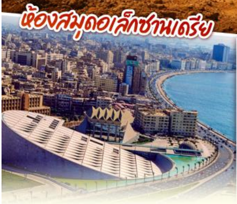
ห้องสมุดอเล็กซานเดรีย