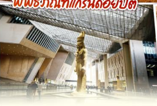
พิพิธภัณฑ์แกรนด์อียิปต์