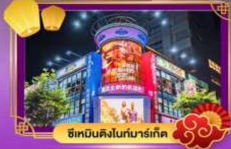
ซีเหมินดิงไนท์มาร์เก็ต