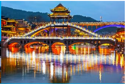
สะพานหงเจียว