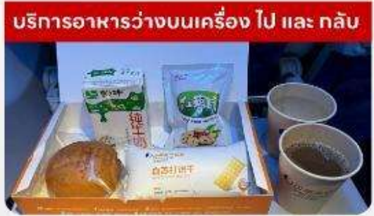
บริการอาหารว่างบนเครื่อง ไป และ กลับ