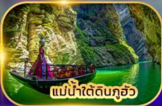
แม่น้ำใต้ดินกุ้ยโจว