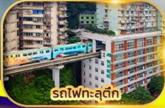
รถไฟฟ้าสุดึก