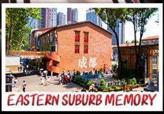
EASTERN SUBURB MEMORY