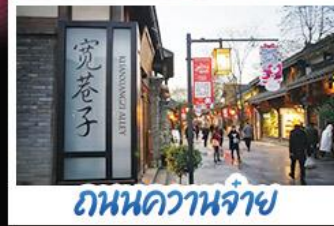
ถนนควานจ้าย