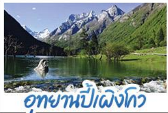
อุทยานปี่เผิงโกว

ภูเขาสัตรีณี อุกยานจิวจ้ายโกว นั่งรถไฟความเร็วสูง น้ำพุไม่ไผ่ตักSKP อุทยานปี่เผิงโกว วัดต้าฉือ ถนนโบราณชวยกว้างชวยแคบ ช้อปปิ้งถนนไถ่กู่หลี่ + ถนนซุนชี่ลู่