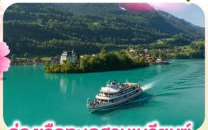
ล่องเรือทะเลสาบเบรียนซ์

พิชิตยอดเขาชุนเนกกา 1 ในเขาที่สวยงามที่สุดเมืองเซอร์แมท