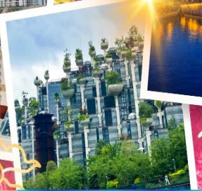
Tian An 1000 Trees